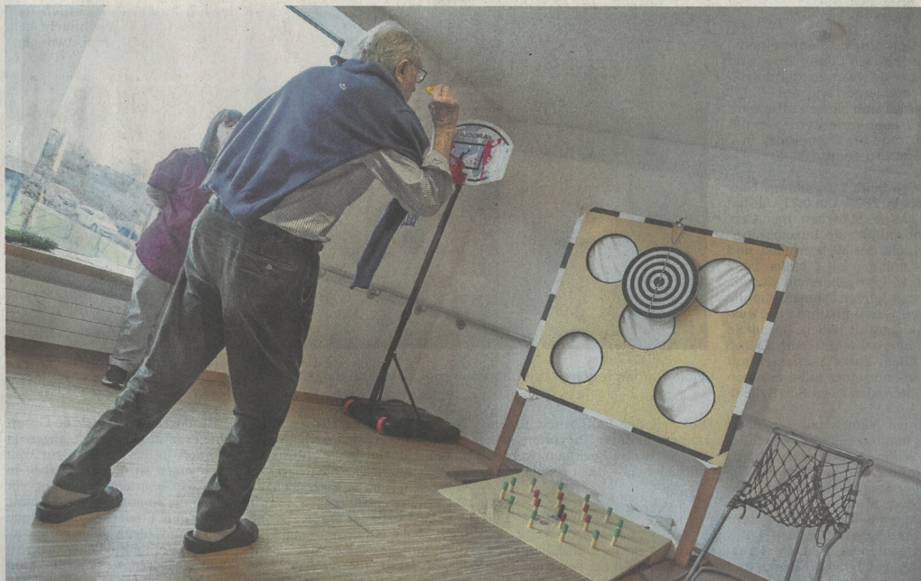
Die Senioren können an vielen Aktivitäten teilnehmen, darunter sportliche Betätigungen und Kochateliers

„Respect de la singularité et de l'intimité“ ist die vierte Regel, die befolgt werden soll: Das Personal soll die