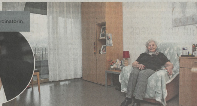
Die älteren Menschen können ihr Zimmer ganz nach ihrem Geschmack einrichten