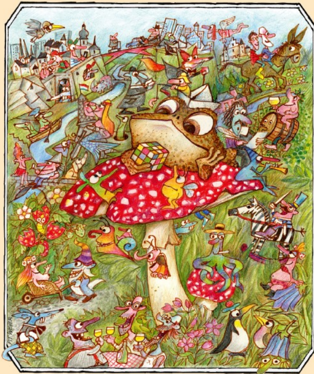
E Lëtzebuerger Orbis Pictus