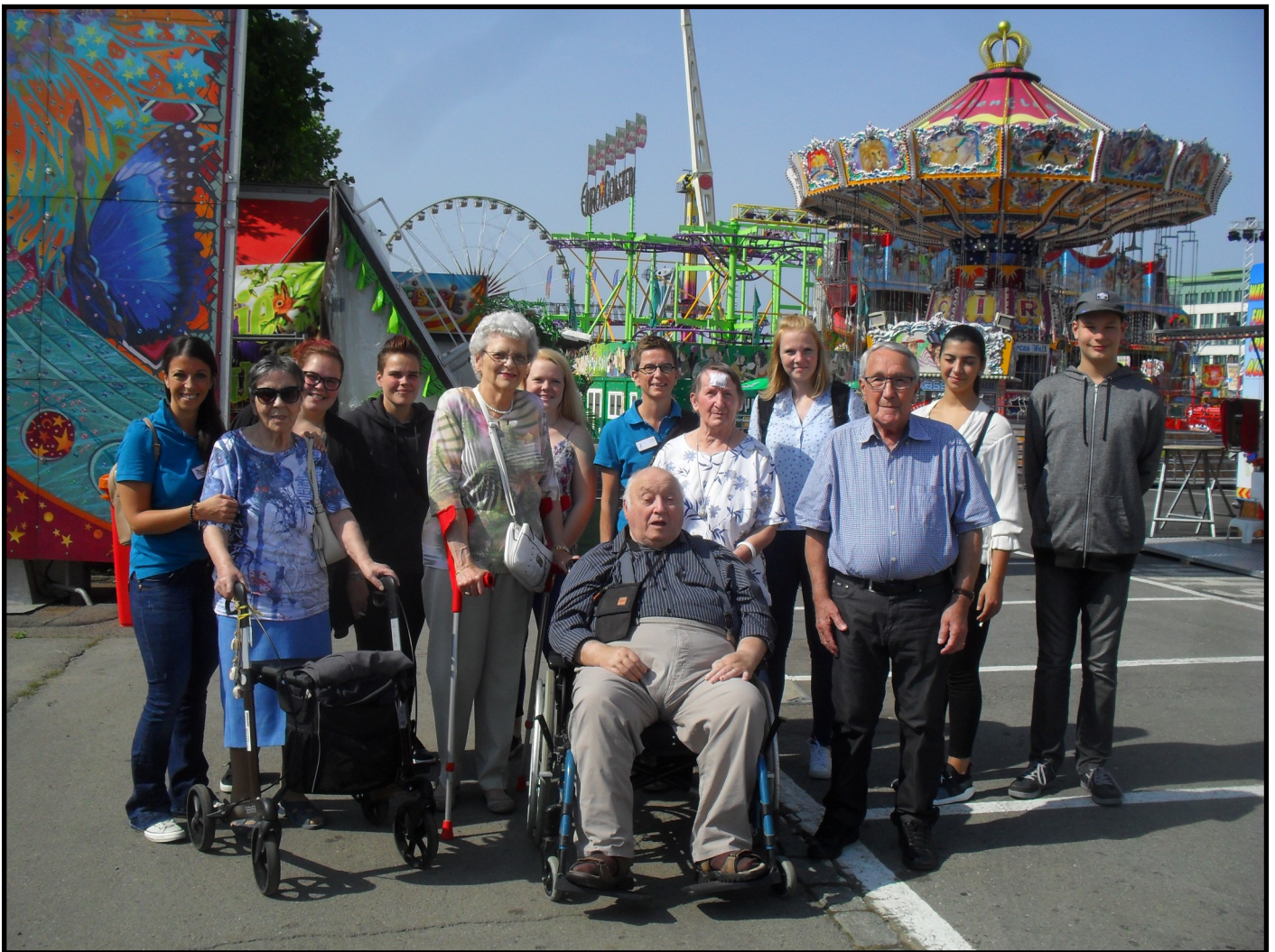
Op der Schueberfouer mam Jugendhaus